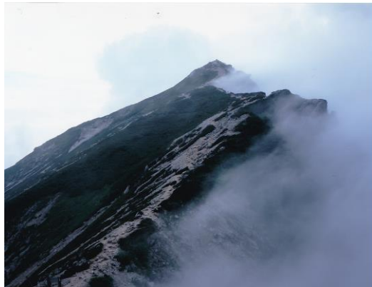
①北アルプス 唐松岳