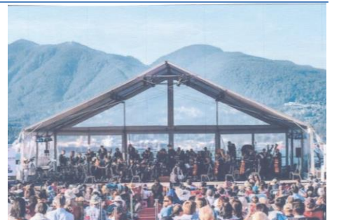
オーケストラの野外コンサート

チャイコフスキー作品24「ロネーズ」から始まり、幾つかのクラシック曲の間に映画ETのテーマや久石譲の「天空の城ラピュタ」が演奏され、アンコールはラテンの「ココチコ」。高層ビル群に面した海岸