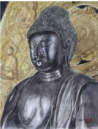
薬師如来 作者 中山 雅雄