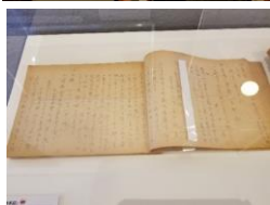
膨大な捜査手記の一部