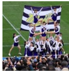
応援部チアリーディング

治27…早稲田31で惜敗。勝てば優勝だったが、5勝2敗に終わった。結果、大学選手権出場枠は