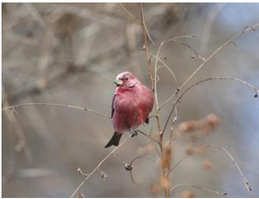
②ベニマシコ (神奈川県・宮ヶ瀬)