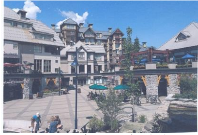
ウィスラーヴィレッジの街並み

一山とブラッコム山を結ぶロープウェイ（全長4.4キロ）のゴンドラは地上から436mを通り、世界一の高さ